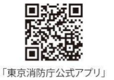
「東京消防庁公式アプリ」

東京消防庁が管理している消防水利(40t以上)の設置場所は右記2次元コード「東京消防庁公式アプリ」より確認できます。