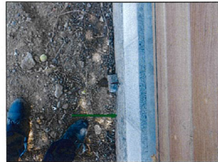
甲ブロック塀写真②