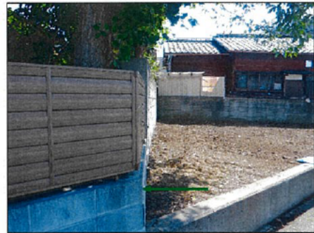
甲ブロック塀写真①