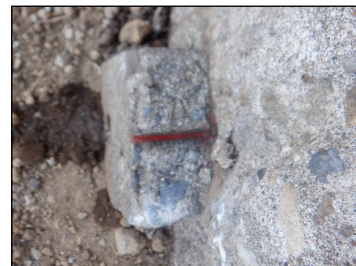
H107 : コンクリート杭