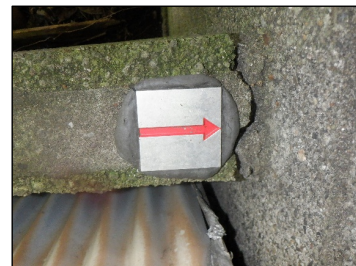
HAP1 : 金属標