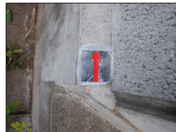
P2 : 金属標