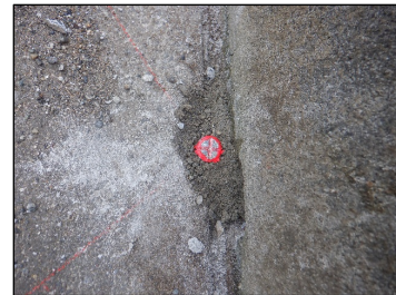
P1 : 鉄

東京都豊島区池袋三丁目24番8号 株式会社根岸事務所 代表取締役 根岸 修 根岸土地家屋調査士事務所 土地家屋調査士 根岸 修 登録番号 東京第7726号 電話 03(5972)1671