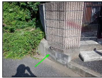
南ブロック塀写真