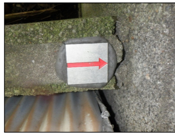
HAP1 : 金属標