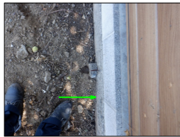
東ブロック塀基礎写真