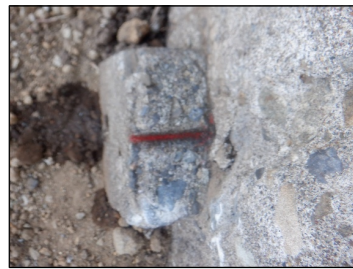
H107 : コンクリート杭