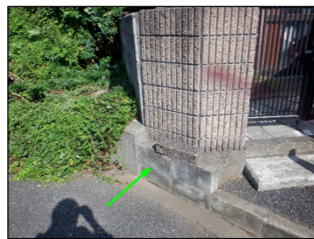
南ブロック塀写真