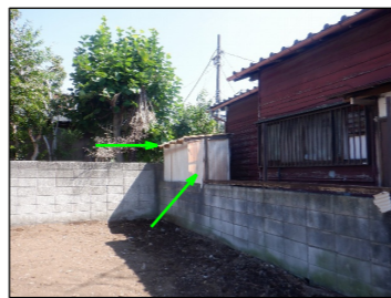
南トタン、トタン屋根写真